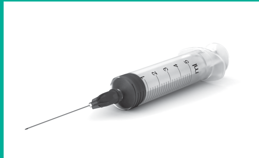
▼ AIGUILLES / SERINGUES

Déchets tranchants comprend tous les objets tranchants utilisés capables de couper ou de percer la peau (à l'exception de ceux contaminés par des produits de chimiothérapie)