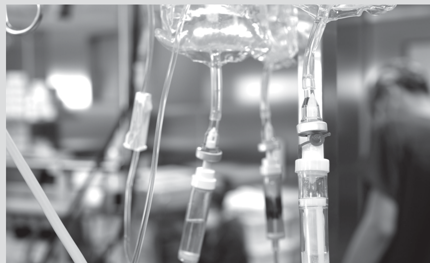
▼ TUBES ET SACS VIDES

Déchets de chimiothérapie traces ce sont des déchets contaminés par contact avec des agents chimiothérapeutiques.