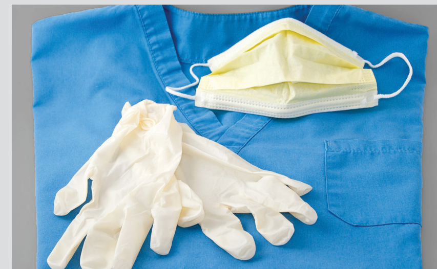
▼ MASQUES ET GANTS